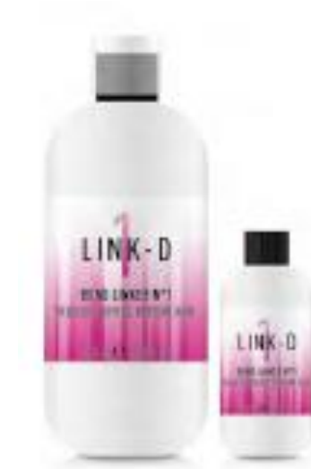
BOND LINKER N°1 500 ML / 100 ML